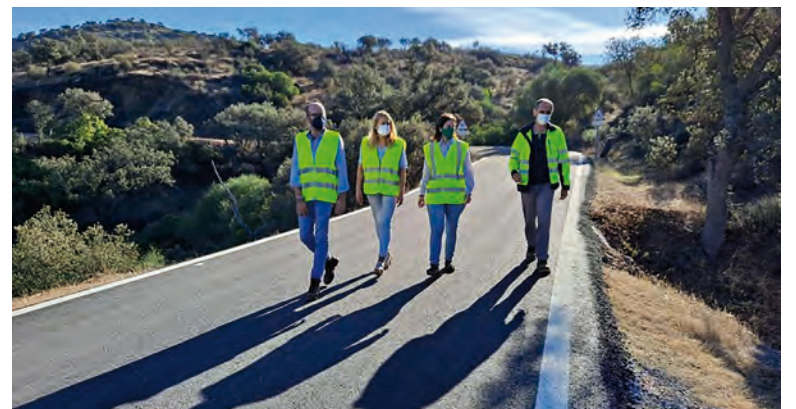
Casanueva visitando la carretera en la que se ha actuado

La Junta de Andalucía ha invertido 90050,72 euros en la mejora de la carretera A-447 que va de Fuente Obejuna a Alanís, según informó la delegada de Fomento, Infraestructuras y Ordenación del Territorio, Cristina Casanueva, que explicó que el Gobierno andaluz "cumple sus compromisos en materia de conservación y mantenimiento de las vías de titularidad autonómica". Casanueva matizó que esta vía llevaba más de 15 años sin ningún tipo de intervención, por lo que se encontraba en muy mal estado. La delegada ha reiterado el compromiso del actual Gobierno para recuperar una carretera que acorta el viaje entre las provincias de Córdoba y Sevilla.