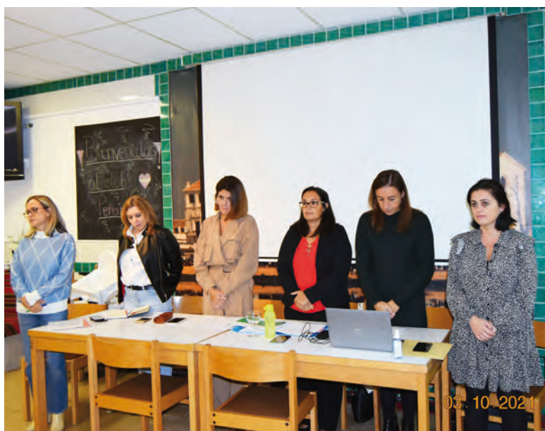
Asamblea realizada en octubre