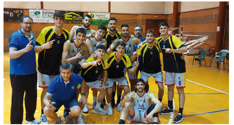
1ª Victoria Equipo EBA 50-42 frente al Novascholl

Jornada 1ª 02-10-21 Jaén CB Paraíso Interior 73 /// Climnavas Agrometal Peñarroya 62