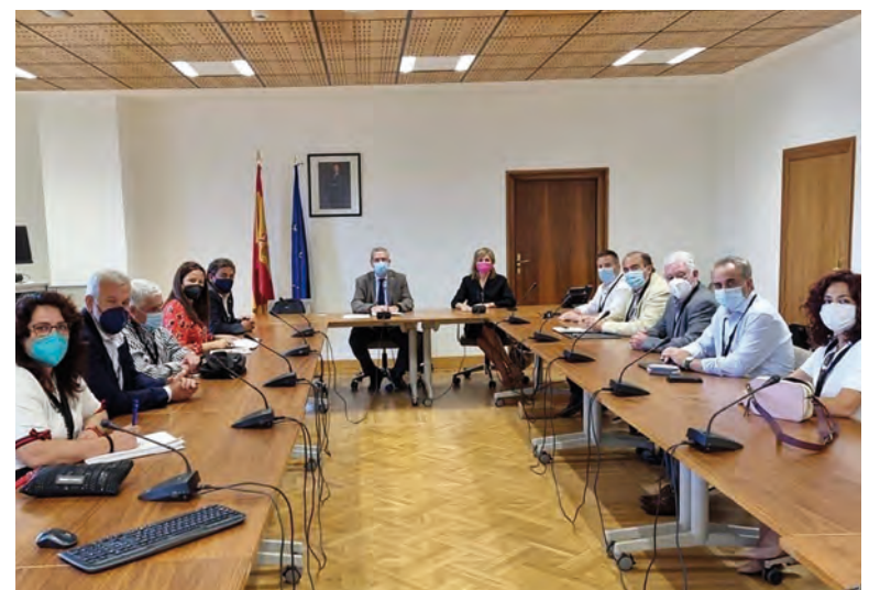
Representantes de la plataforma Provincia 51 en un momento de la reunión

"El secretario nos trasladó la necesidad de trabajar sobre un proyecto de futuro, que es en lo que estamos