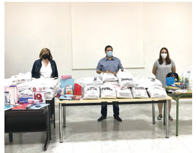
Lotes de material que se han repartido