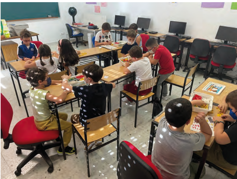
Participantes de uno de los cursos

Desde la concejalía de juventud se ha mostrado satisfacción por la gran acogida que ha tenido la actividad, y han deseado que disfruten aprendiendo, tanto con la creación de robots y su programación, como con valores tan importantes, que se trabajan de manera transversal, como son la cooperación, el respeto y el saber escuchar.