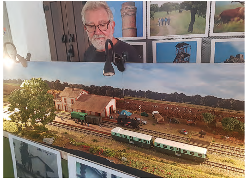
Maqueta de la estación de Villanueva del Duque con el autor

La misma la ha podido realizar con tanta exactitud y a escala H-0 o 1,87 mm., para modelismo, gracias a los nueve meses dedicados a la investigación y a la documentación, más los seis meses que ha tardado en realizarla con todo lujo de detalles, tanto ferroviarios como paisaje exterior, en el que incluye, como dato curioso, hasta un águila posada sobre el depósito de agua existente en algunas estaciones. En ella incluye cambios de agujas para el cambiar de vía, un tren de mercancías con la máquina Bagtignoles y la Nº 11 Villanueva del Duque por separado, así como los famosos automotores Billard A 150 DT para viajeros, reproducidos expresamente para este trabajo al no existir maquetas de los mismos en el mercado. Y todo