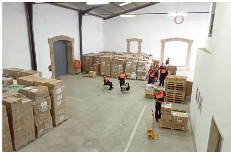
Material que se ha recogido para ayudar a las personas afectadas por el volcán

La delegada explicó que simultáneamente se ha mejorado la seguridad en la vía con la instalación de barreras de seguridad metálicas con sistemas homologados en varios tramos entre los puntos kilométricos 3,566 y 5,452 con una inversión de 45690,81 euros.