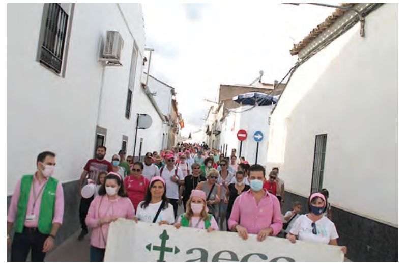
Uno de los momentos de la marcha

nocturna durante estos días, será de color rosa. Desde ahí se partió hasta la Plaza del Mercado y acceder de nuevo a la Plaza del Santo, desde donde se había partido. Una vez finalizada la caminata, se pudieron degustar unos exquisitos churros con chocolate, en una tarde otoñal siempre sientan bien. Antes de partir, se hizo entrega por parte de Herminia Marcado, de la recaudación de lo obtenido a través de Nancy Solidaria. Agradecer a Protección Civil la gran labor realizada durante toda la jornada.