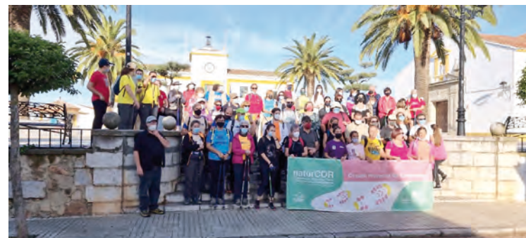
Participantes en esta ruta

Finalmente hubo una comida, que se aprovechó para intercambiar impresiones y fotos del día.