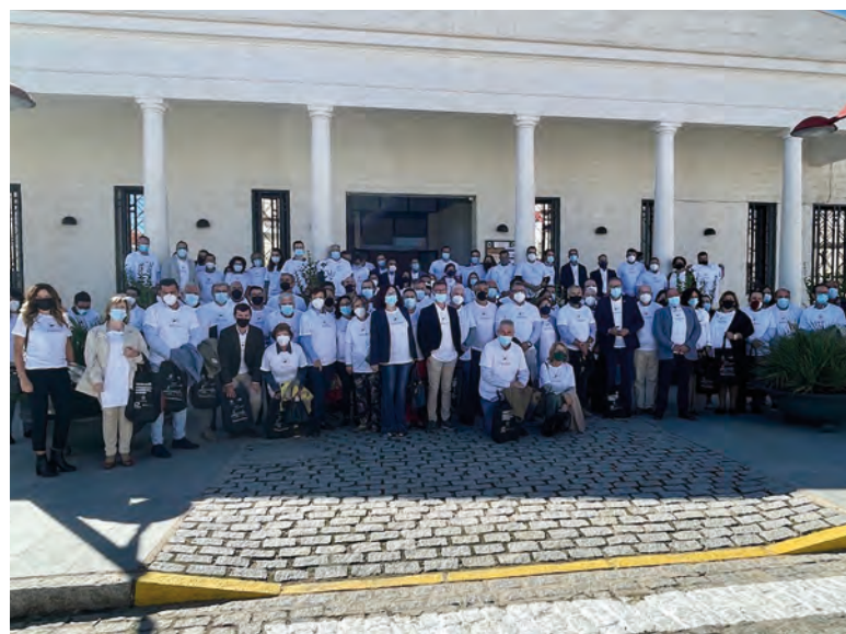
Asistentes a la reunión

Todas estas cuestiones fueron expuestas, pero también otras realidades como la necesidad del