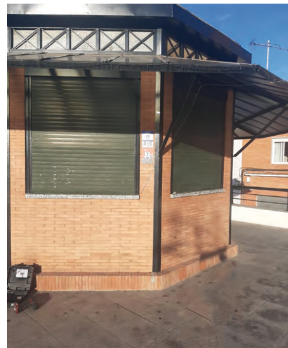
Uno de los puntos en los que se ha instalado dispositivos

Los usuarios deben descargarse la aplicación OkLocated» y al estar por un entorno cercano de un lugar de interés que tenga instalado estos dispositivos, el móvil automáticamente a través de tecnología bluetooth, sin necesidad de red de datos, muestra la información de dicho enclave.