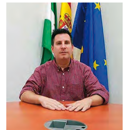
Expósito informando de los pagos a autónomos y pymes

El alcalde, José Ignacio Expósito (PSOE), indicó que "el objetivo del Ayuntamiento es ayudar al mantenimiento de la actividad empresarial en nuestro municipio, de forma que las empresas de nuestra ciudad puedan afrontar los gastos estructurales y del negocio en estos