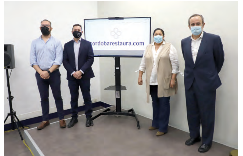
Acto de presentación de esta plataforma

Así, se ofrece información sobre los modelos de comportamiento del cliente, un servicio de búsqueda de profesionales, actividades de formación, otra línea enfocada a la transformación digital mediante apli-