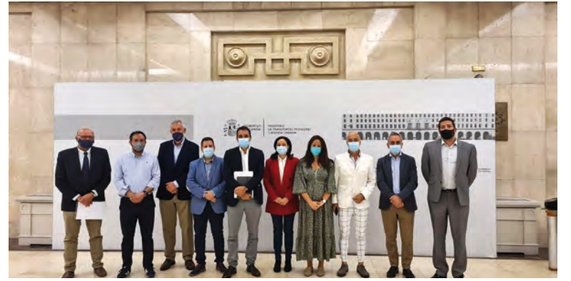
Asistentes a la reunión para el inicio de los trámites de la A-81

También tienen previsto aprobar provisionalmente en unos meses el estudio informativo del corredor