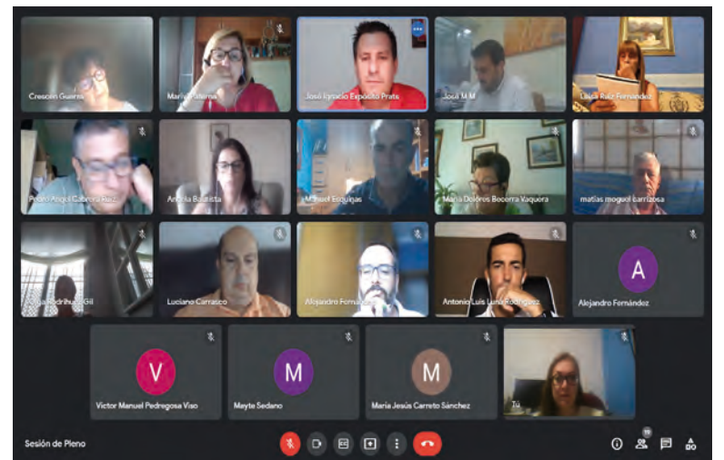
Pleno telemático del Ayuntamiento de Peñarroya