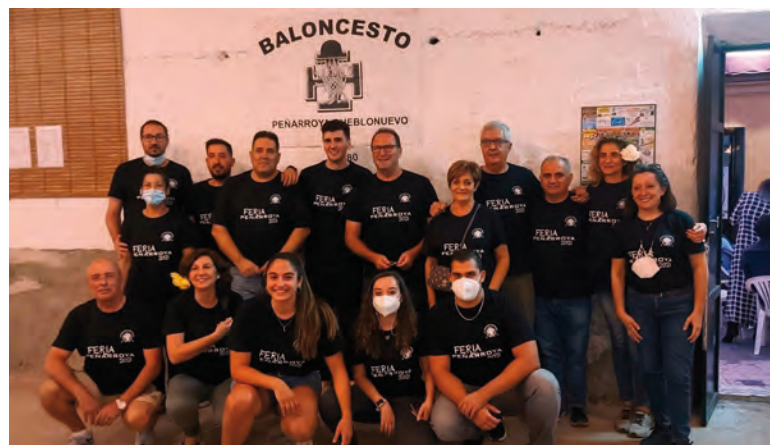
Componentes de la caseta del Bacalao en esta Feria

Acabada la feria, el Club Polideportivo Peñarroya-Pueblonuevo quiere agradecer a todas las personas que han llenado día tras día la caseta con su presencia, a todos los socios que han colaborado aportando su trabajo desinteresado