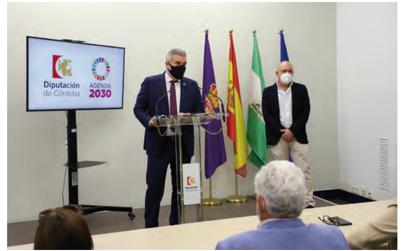
Acto en el que se informó de este Proyecto de Comercio Digital

Este proyecto se va a llevar a cabo en base a tres pilares la formación práctica sobre la nueva economía