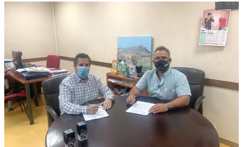
Firma del convenio por el que se actuará en dos caminos

El presupuesto de la actuación que se va a ejecutar es de 41.152 euros, de los que la institución provincial aporta 30.483 euros, siendo la aportación municipal de 10.669 euros.