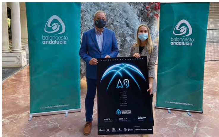
Presentación del Campeonato Andaluz de Selecciones Cadetes

Como cualquier campeonato de selecciones con jugadores base, el Campeonato Cadete Masculino de Selecciones Provinciales reunirá a muchos de los mejores jugadores andaluces de baloncesto que destacan por su juego a tan temprana edad,