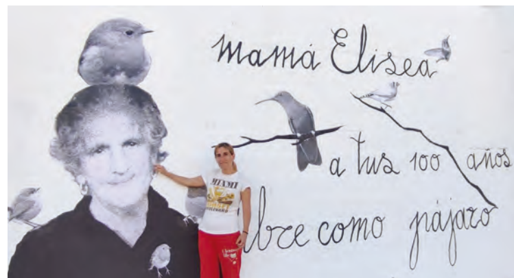
Mural que se ha elaborado en Fuente Obejuna